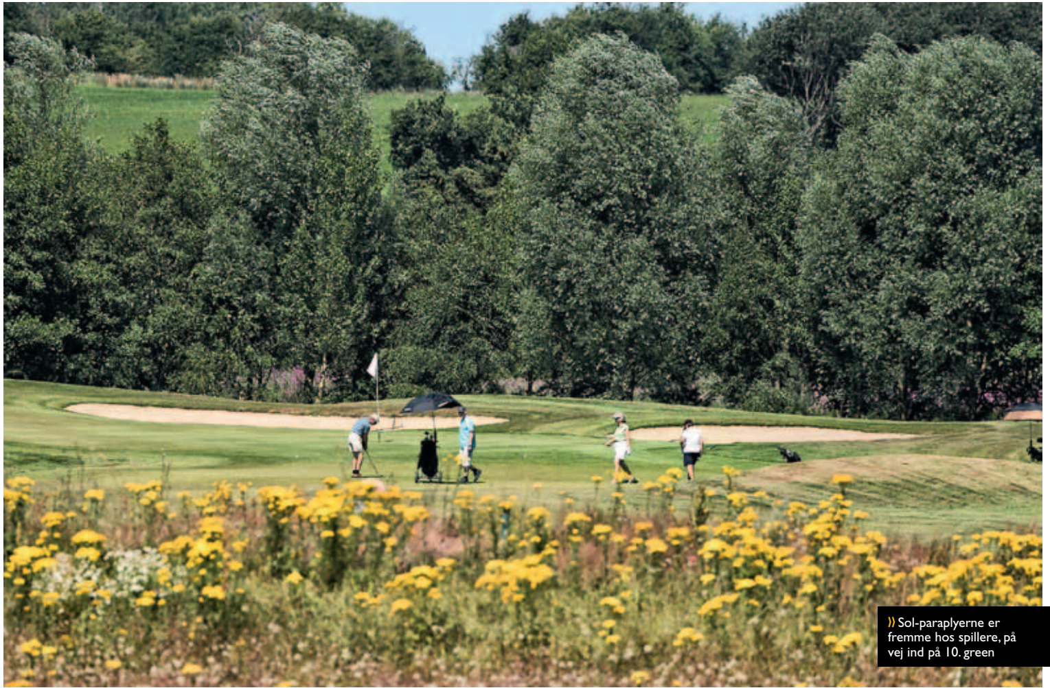
» Sol-paraplyerne er fremme hos spillere, på vej ind på 10. green

» Ligeledes fik vi etableret en klub, der er til for og ejet af medlemmerne selv, et særsyn i mange af de baneetableringer, der fandt sted efter år 2000, hvor de fleste havde rod i 'investorprojekter', med økonomisk afkast for øje."