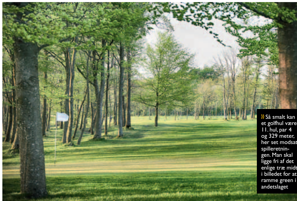
» Så smalt kan et golfhul være: 11. hul, par 4 og 329 meter, her set modsat spilleretningen. Man skal ligge fri af det enlige træ midt i billedet for at ramme green i andetslaget

En lokal avis skrev: "Den bynære bane er an- >