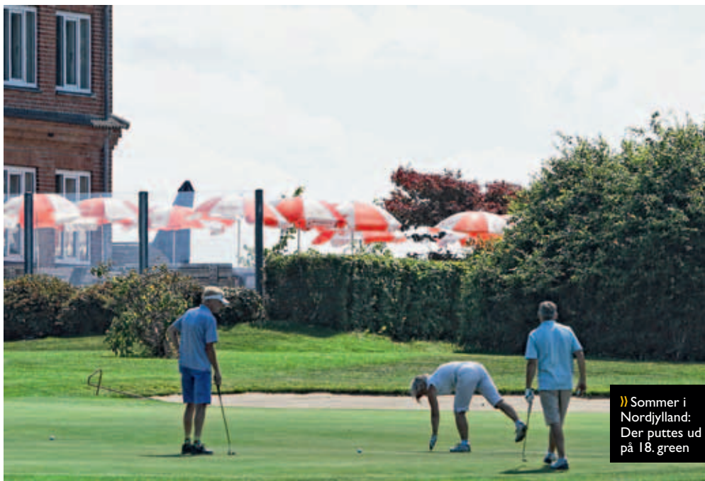
» Sommer i Nordjylland: Der puttes ud på 18. green