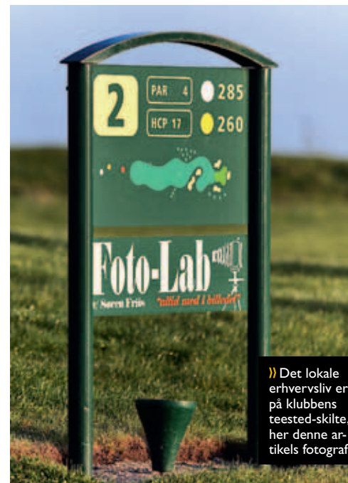
» Det lokale erhvervsliv er på klubbens teested-skilte, her denne artikels fotograf

sætning. Formentlig inspireret af den amerikanske skuespillerindes berømte "More Demi Moore"-fotoserie forestiller de en meget lidt påklædt kvinde i meget lykkelige omstændigheder – og i meget usædvanlige omgivelser som for eksempel på kanten af en grusgrav.