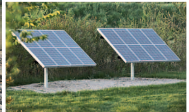
» Tv.: Medlemmerne leverede næsten al arbejdskraften, da åen og stensætningen tværs over 8. fairway blev anlagt. Herover: Solceller leverer strøm til den pumpe, der holder gang i åens vand